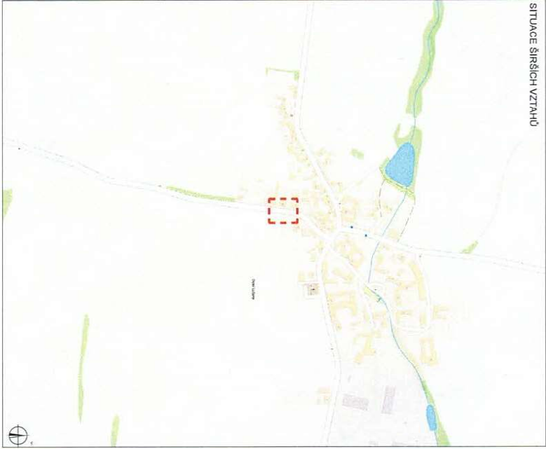
SITUACE ŠIRŠÍCH VZTAHŮ

PLÁNOVÁNÍ PRŮJEKTU MĚSTSKÝ ÚŘAD Moravské Budějovice Odbor dopravy a silničního hospodářství -10- 10. 04. 2021 E. Hrnčířová